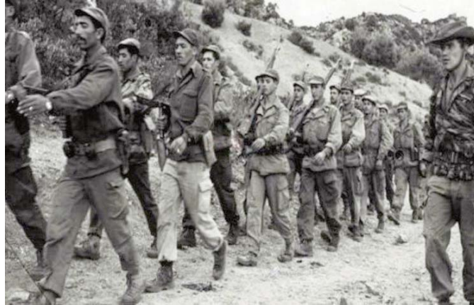
Evoquant les qualités du commandant de la wilaya III historique, et fils prodige du village de Tassafth Ouguemoun, le ministre a souligné son "intelligence supérieure et sa sagesse", assurant que l'Algérie "sait juger de la valeur de ses hommes et ne tourne pas le dos à ses fidèles et ses héros".