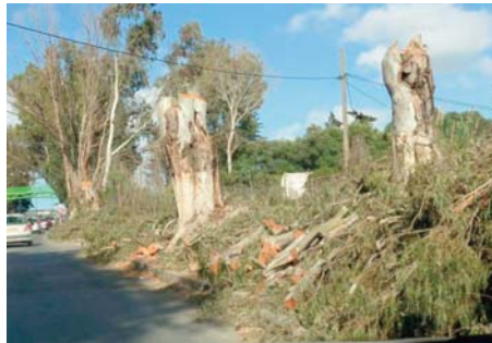
Le ministère de l'Agriculture et du Développement rural rappelle que "toute opération d'abattage en milieu urbain et suburbain et au bord des routes exige

Face à l'abattage illégal des arbres au niveau de certaines wilayas, le minis-