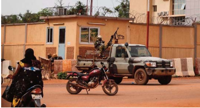
formation du Burkina (AIB). Le Burkina Faso reste en proie

Des dizaines de terroristes dont des "leaders" ont été neutralisés dimanche dans des "frappes de haute précision" dans les régions de l'Est et du Centre-Nord du Burkina Faso, avait rapporté l'Agence d'in-