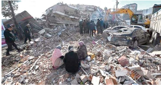
Syrie, lundi 6 février à l'aube, suivi d'un autre tremblement de terre quelques heures plus tard, d'une magnitude de 7,6.

Un séisme d'une magnitude de 7,7 sur l'échelle de Richter, a secoué la Turquie et la