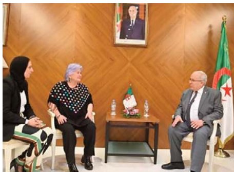
du non-alignement pour un monde pacifique et juste", a précisé la même source. Dans une déclaration aux

"L'entretien a porté sur les relations historiques de solidarité et de coopération entre l'Afrique et l'Amérique latine et les perspectives prometteuses de leur renforcement à la faveur des valeurs unissant les pays et les peuples des deux ensembles, forgées dans leurs luttes communes pour l'émancipation du joug colonial et qui se manifestent aujourd'hui dans leur soutien inconditionnel aux causes justes des peuples palestinien et sahraoui, ainsi que dans leur volonté partagée de promouvoir les principes