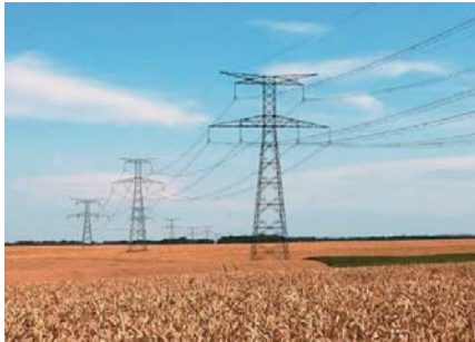
Smara, les grands pôles d'habitation rurale d'Ain Nahas et de Guettar El Aich, relevant de la commune d'El Khroub,