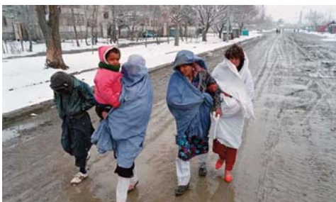
Ce froid extrême a touché, entre autres, les provinces de Takhar, Badakhshan, Nimroz, Kandahar, Laghman, Ghazni,

Cent quatre personnes ont perdu la vie en raison d'une vague de froid avec de fortes chutes de neige en Afghanistan au cours des deux dernières semaines, a déclaré lundi le porte-parole du ministère de la Gestion des catastrophes naturelles et des Affaires humanitaires, Shafiullah Rahimi.