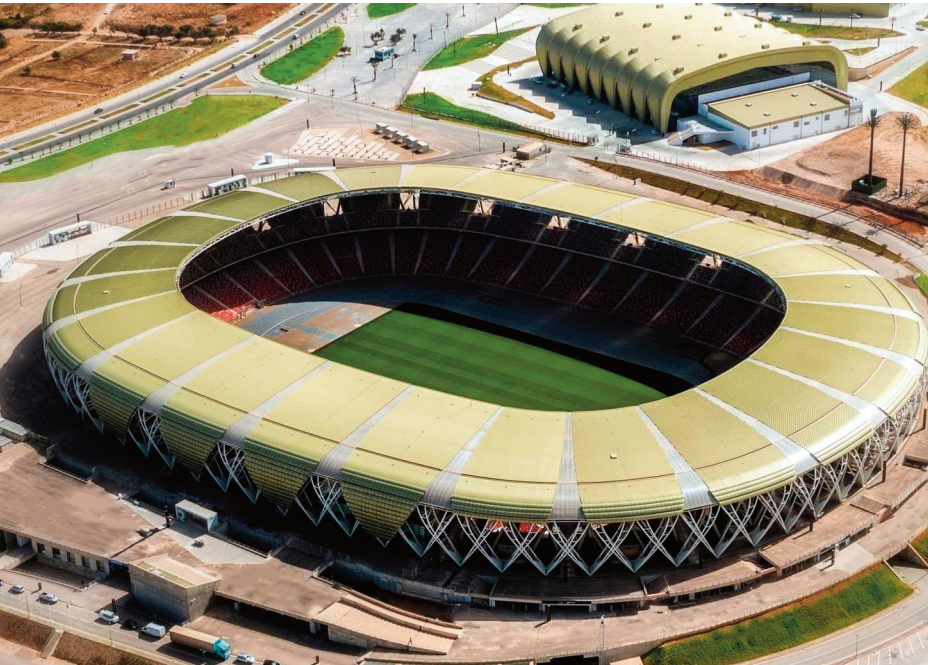
sept du premier tour (phase de groupes), un match des quarts de finale et un autre des demi finale, ainsi que le match de classement pour la troisième place.

sportif olympique, dont une équipe médicale sera destinée à la prise en charge du public avec une ambulance équipée. Quant aux structures de santé, deux établissements pilotes ont été choisies pour recevoir les cas urgents au sein du Couloir Vert réservé pour cette manifestation, à l'Etablissement hospitalo-universitaire "1er novembre 1954" et au Centre hospitalo-universitaire (CHU) "Dr Benzédjeb". Chaque établissement a été doté 8 lits de réanimation, 10 lits extensibles d'hospitalisation et un bloc pour les opérations chirurgicales. Aussi, six établissements publics de santé de proximité (EPSP) avec leurs personnels médical et paramédical seront mis à disposition en cas de besoin, à savoir les ESPS situés à hai Seddikia, au boulevard Front de mer, à hai Ghoualem, à hai Bouamama (Oran), aux communes d'Es-Sénia et de Oued Tlélaten, a indiqué la même source. Pour rappel, le stade "Miloud Hadfi" d'Oran, d'une capacité de 40 000 places, accueillera dix matches de la septième édition du CHAN", dont