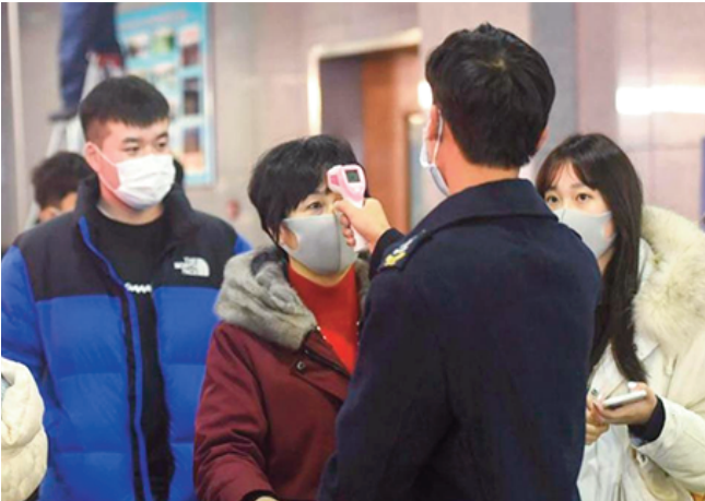
çage du génome disponibles bres de l'Union européenne sur ces cas". Les Etats mem- doivent discuter mercredi

Le gouvernement du Canada avait annoncé plus tôt une mesure identique, en "réponse à la poussée de Covid-19 en République populaire de Chine et en raison du peu de données épidémiologiques et de séquen-