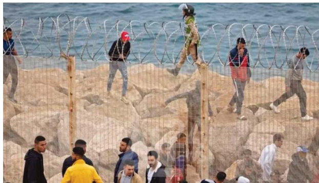
breuses tentatives de migrants d'entrer à Melilla et Ceuta, seules frontières terrestres de l'Union européenne avec le continent africain.

Ce drame migratoire est le plus lourd jamais enregistré lors d'une des nom-