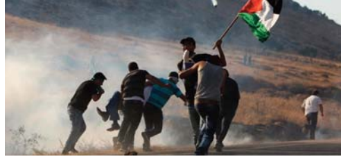
martyrs, dont 15 enfants et quatre femmes, lors d'une série de raids aériens contre la bande de Gaza.

forces sionistes, et intervient après une année particulièrement sanglante. Selon l'ONU, plus de 150 Palestiniens sont tombés en martyrs l'an dernier dans des opérations sionistes en Cisjordanie occupée, dont 33 enfants, bilan le plus lourd depuis la fin de la Seconde Intifada, soulèvement palestinien du début des années 2000. Au plus fort de l'agression sioniste en août dernier, au moins 44 Palestiniens sont tombés en