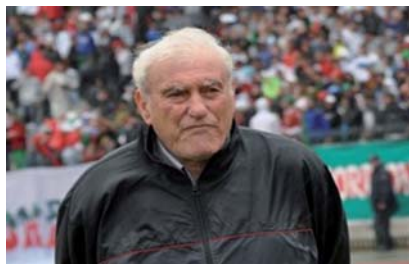
cien défenseur international algérien des années 1990, la formation relizanaise a perdu ses deux premiers matches en championnat sur le terrain du DRB Tadjenanet (2-1) et à domicile contre le MC Alger (1-0), mais elle s'est ressaisie lors de la troisième journée en déplacement contre le RC Arbaâ (1-0).