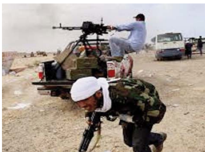
avaient attaqué une position de l'armée située à 8 km au sud-ouest de la ville

«Trois soldats ont été tués et quatre autres blessés dans une attaque menée à l'aube par des terroristes liés à la branche libyenne de Daech», a indiqué le porte-parole, précisant que les assaillants