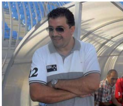
tion mouloudéenne est à jour sur le plan financier, avait affirmé récemment le président du club.