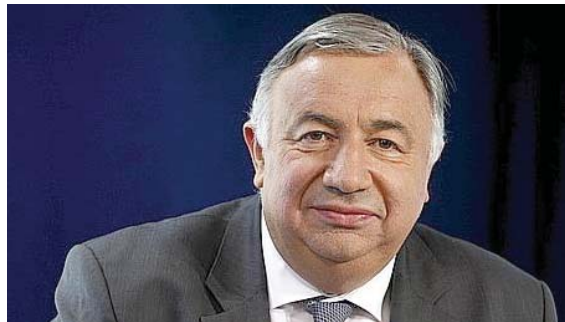
Le président du Sénat français, Gérard Larcher

Le président du Sénat français, Gérard Larcher, effectuera du 8 au 11 septembre une visite en Algérie à l'invitation du président du Conseil de la nation, Abdelkader Bensalah, a indiqué hier un communiqué du conseil. La visite de M. Larcher, qui sera accompagné d'une importante délégation du Sénat français, entre dans le cadre de la coopération parlementaire entre l'Algérie et la France. Au premier jour de sa visite en Algérie, le président du Sénat français rencontrera M. Bensalah au siège du Conseil de la nation. M. Larcher doit également rencontrer au cours de son séjour des responsables du Parlement et du gouvernement.