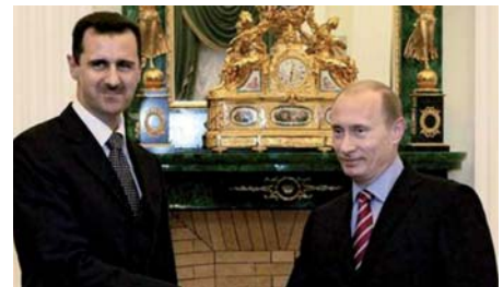
Damas. Le but de Moscou est de parler d'une même voix au gouvernement syrien.

Les déclarations du président russe interviennent alors que la Russie a multiplié ces dernières semaines les contacts avec quasiment toutes les mouvances de l'opposition syrienne, des adversaires d'Assad en exil aux représentants de la société civile ou responsables politiques syriens tolérés par