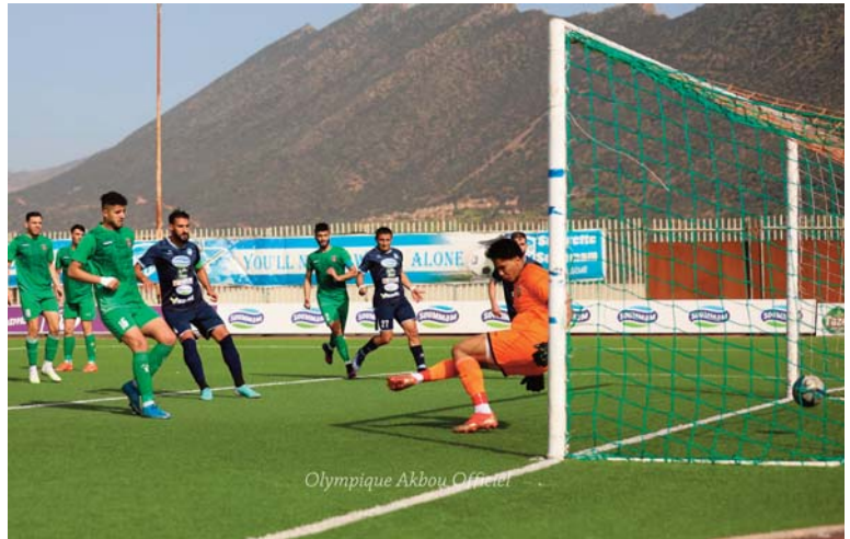
Olympique Akbou Officiel

Les "Sang et Or" viseront la victoire pour améliorer leur position au classement, après une série de bons résultats à la fin de la phase aller, alors que le RCK qui reste sur une belle qualification aux 8es de finale de la Coupe d'Algérie aux dé-