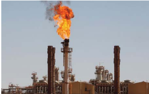
retarderait les réformes...

Le même responsable a également souligné que la filière de la tomate, dans ses deux segments de production et de transformation, est parvenue à satisfaire le marché national et possède des capacités à l'export.