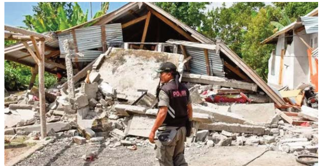
Près de 1200 touristes en cours d'évacuation depuis les petites îles de Gili

L'Indonésie, un archipel de 17.000 îles et îlots, se trouve sur la ceinture de feu du Pacifique, une zone de forte activité sismique. Ce pays est frappé par de nombreux séismes, mais la plupart ne sont guère dangereux.