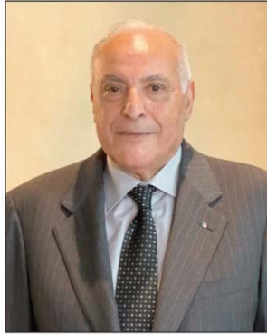
Sahara occidental et le projet de création d'une opération onusienne de

Les deux parties ont, par ailleurs, procédé à un échange de vues sur plusieurs questions inscrites à l'ordre du jour du Conseil de sécurité, notamment les développements de la situation à Gaza, la question du