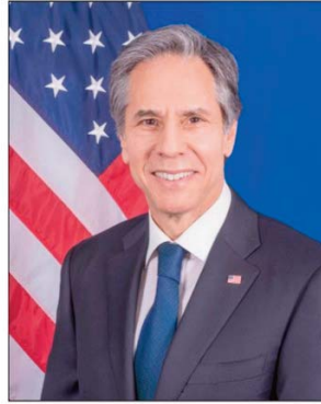
maintien de la paix en Haïti, conclut le communiqué.